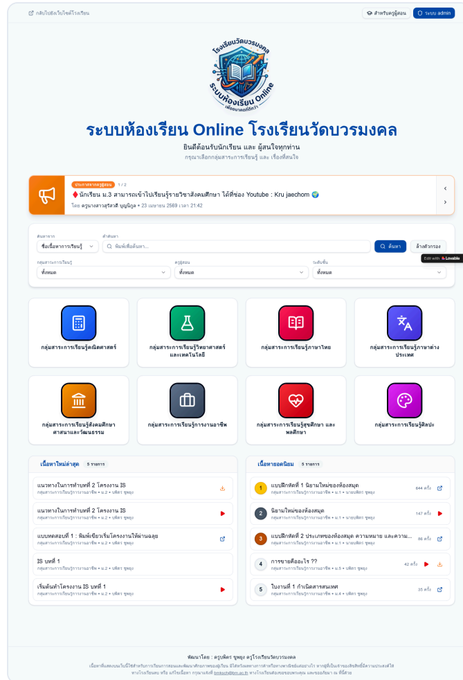
ภาพที่ 1 – หน้าแรกแสดงรายการเนื้อหาและยอดเข้าชม

หน้าแรกจะแสดงรายการเนื้อหาทั้งหมด พร้อมยอด "เข้าชมแล้ว" ของแต่ละบทเรียน